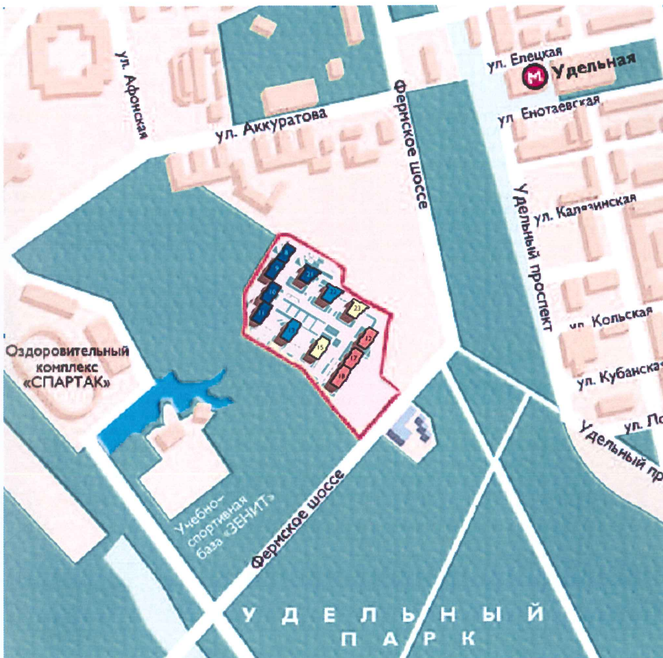
СХЕМА РАЗМЕЩЕНИЯ ОБЪЕКТА

Приложение № 2 к Проектной декларации от 30.07.2013г. О проекте строительства комплекса жилых домов со встроенно – пристроенными помещениями, 1-4 этап строительства, корпуса 8-9, 10-11, 12, 13, 15, 17-18, 21, 22, 23 и пристроенной автостоянки по адресу: г. Санкт-Петербург, Фермское шоссе, д.22, литр В От 30.07.2013г.